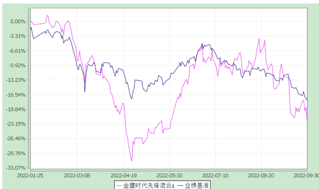
金鹰时代先锋混合 C: