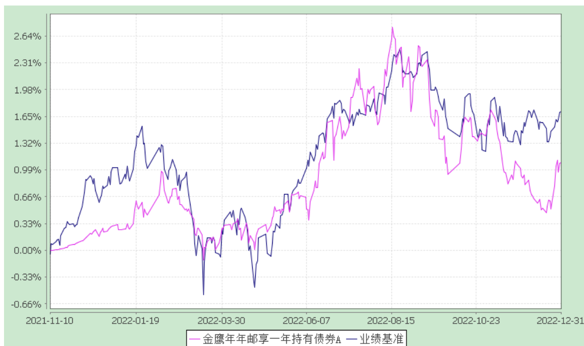
金鹰年年邮享一年持有债券 C