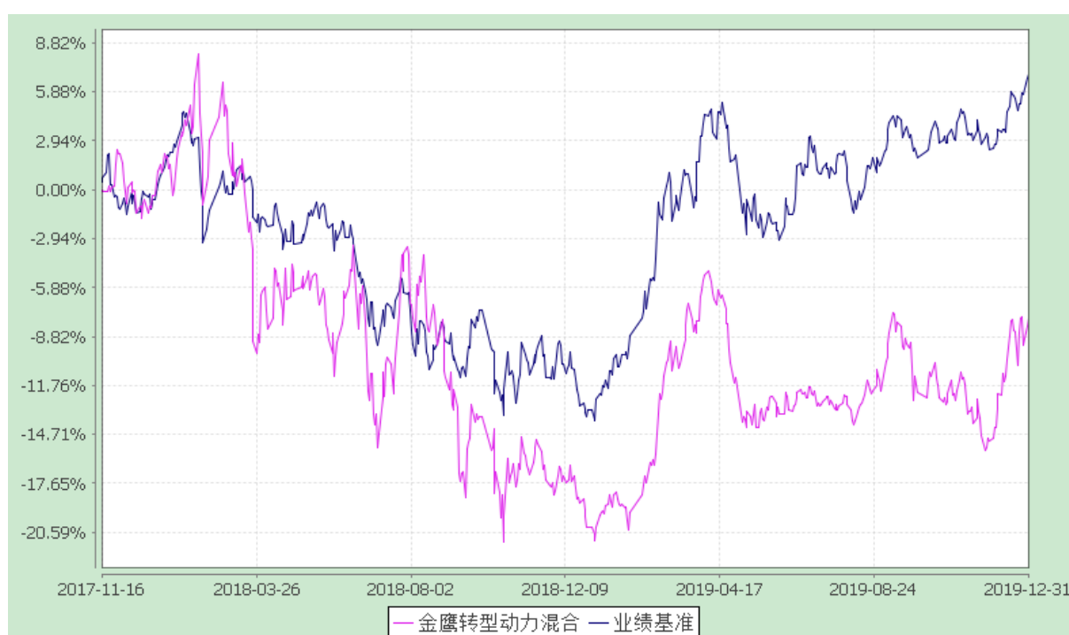
自基金合同生效以来份额累计净值增长率与业绩比较基准收益率的历史走势对比图 (2017 年 11 月 16 日至 2019 年 12 月 31 日)