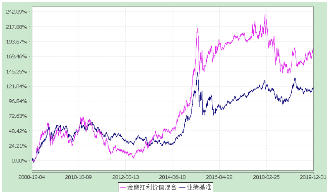
金鹰红利价值灵活配置混合型证券投资基金 累计净值增长率与业绩比较基准收益率历史走势对比图 (2008年12月4日至2019年12月31日)