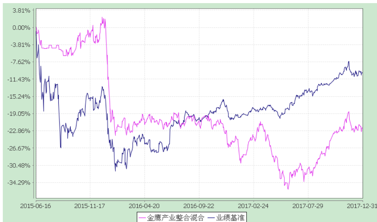
份额累计净值增长率与业绩比较基准收益率的历史走势对比图 (2015 年 6 月 16 日至 2017 年 12 月 31 日)