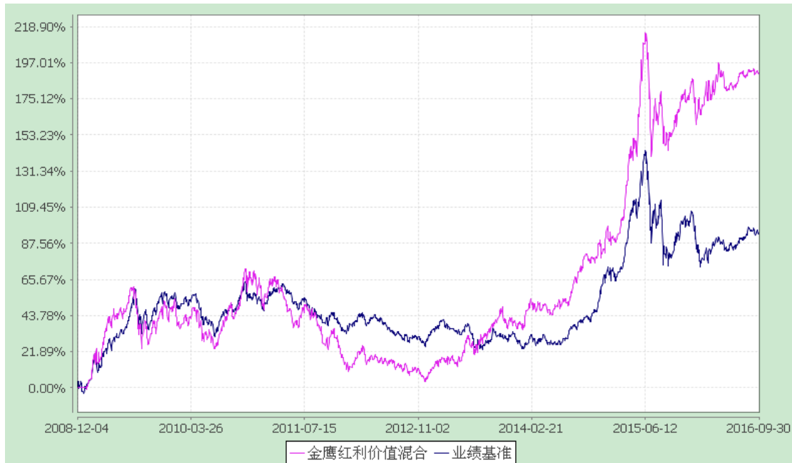
金鹰红利价值灵活配置混合型证券投资基金 累计净值增长率与业绩比较基准收益率历史走势对比图 (2008 年 12 月 4 日至 2016 年 9 月 30 日)

注：(1) 截至报告日本基金的各项投资比例已达到基金合同规定的各项比例；(2) 本基金的业绩比较基准为：中证红利指数收益率×60%+上证国债指数收益率×40%。